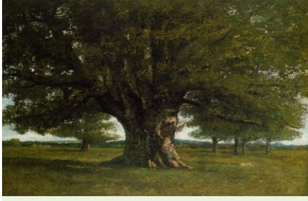
« Le chêne de Flagey »