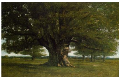
« Le chêne de Flagey »